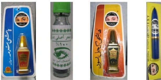
Hashmi Summa Special "Pure kohl from the Hashmi Kohl Aswad Hashmi Kajal

این ها میکپ های عنعنوی چشم اند که بطور غیرقانونی به ایالات متحده امریکا از تعداد زیادی کشور های آسیا؛ افریقا و شرق میانه آورده میشود. در چشم و جلد خانمها؛ مردان؛ نوزادان و اطفال خورد استفاده میشود. بعضی از این محصولات مقدار زیاد سرب دارند که برای صحت تان خوب نمیباشد.