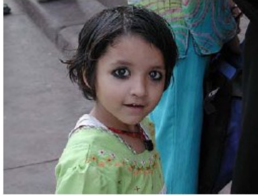
دخترک خورد با چشمان سرمه (کول)